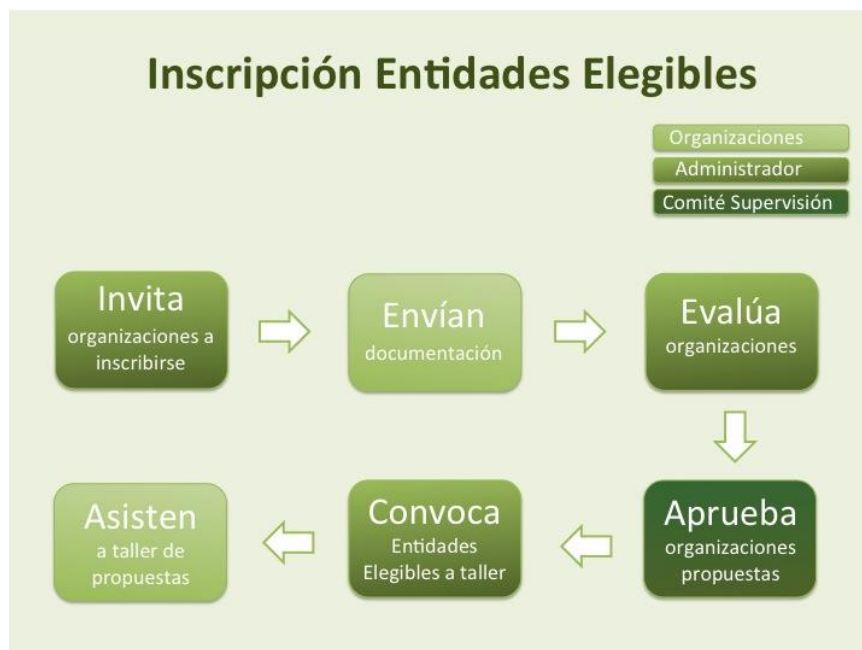
Figura 1. Diagrama del proceso de inscripción de nuevas Entidades Elegibles del II Canje de Deuda.